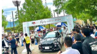
多くの来場者で盛り上がったラリーイベント

Q 5月12日に裾野市運動公園にて開催された、トヨタガソリンレーシングラリーチャレンジイン富士山すその2024の開催による経済効果は？