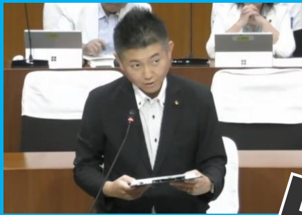
6月定例会にて一般質問