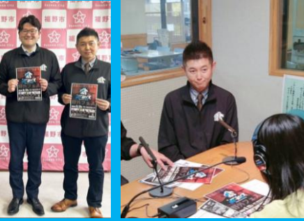
SUSONO HOE-ROCKのPRにVOICE CUEへ