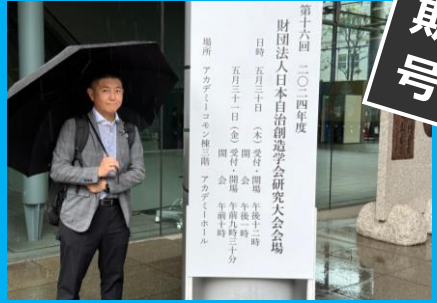
日本自治創造学会 研究大会へ参加