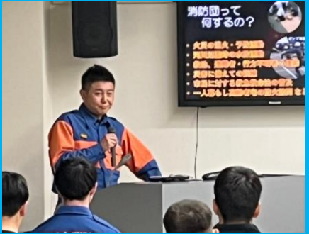
消防団新入団員研修会