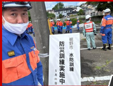
5月20日に開催された 裾野市水防訓練