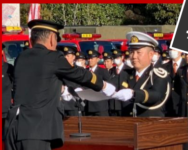
勤続20年9カ月功労章を いただきました