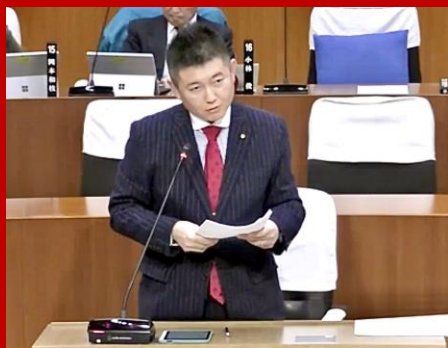
2月定例会にて一般質問を行いました