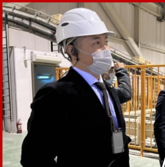
コアレックス信栄株式会社視察